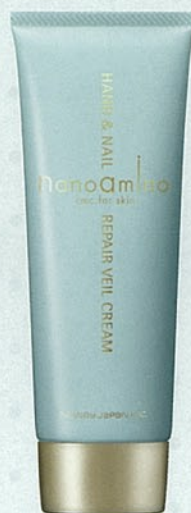
無香料 ハンド＆ネイルベールクリーム 120g ¥2,200 / 40g ¥1,200